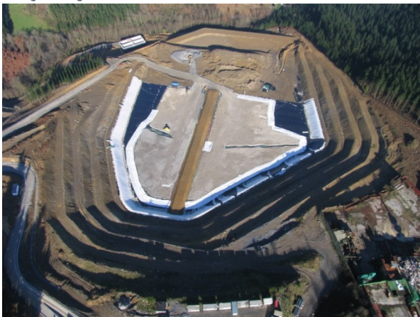
Vertedero de RNP de Betearte Proyecto y D.O. de LURGINTZA