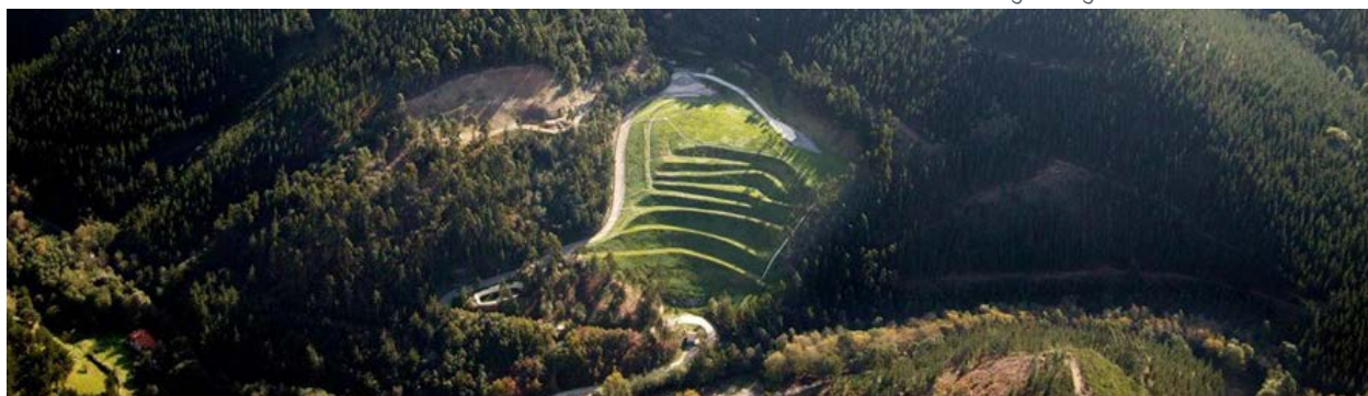
Sellado y recuperación ambiental del vertedero de RU de Amoroto